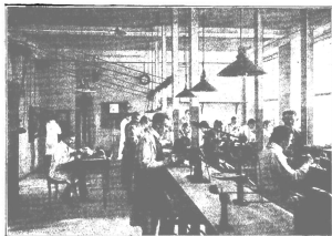
Eine Uhrmacherwerkstatt (Saal Hesse)